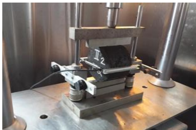
Gambar 4. Alat pengujian kelelahan ( fatigue test equipment )