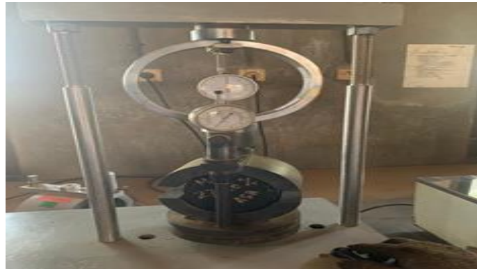
Gambar 1. Alat Pengujian Marshall

Pengujian volumetrik dan parameter Marshall untuk campuran aspal dingin antara lain: