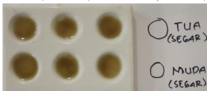
Gambar 1 Ekstrak Air Daun Asam Jawa ( Tamarindus indica L. ) Segar Muda dan Tua