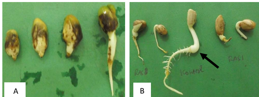
Gambar 1. Gejala hambatan filtrat kultur pada perkecambahan kacang tanah, A= semua kecambah menghasilkan kecambah abnormal, B= kecambah tumbuh normal pada media tanpa filtrat kultur (anak panah) dan yang lain kecambah abnormal

filtrat kultur ras cendawan. Benih kacang tanah pada filtrat kultur umumnya menghasilkan kecambah abnormal, kecambah hanya mampu memunculkan akar, namun tunas tidak berkembang dan akhirnya kecambah mati (Gambar 1).