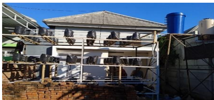
Gambar 2. Jaringan Irigasi Tetes Uji dengan media tanam polybag

Pada tahapan ini kegiatannya terdiri dari pembuatan jaringan irigasi tetes dengan lahan tanam polybag, dan pembuatan tower air dari besi. Untuk mengalirkan air irigasi dari tower digunakan pipa pvc ¼ inchi dan panjang pipa tetes yang akan digunakan disesuaikan ketersediaan ruang dalam hal ini berukuran 4x (1,5m x 4m x 1m ) dengan 4 tingkat. Jarak antara tingkat lahan irigasi tergantung pada tinggi tanaman maksimum yang akan ditanam dan kemudahan pemeliharaan tanaman dalam usahatani sekitar 70 cm seperti pada gambar berikut.