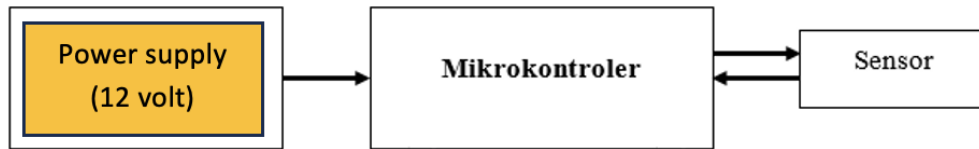
Gambar 1. Desain sistem pengukuran EC-salinitas menggunakan sensor dan mikrokontroler berbasis IoT (Budianto et al., 2021)

Sensor ini dihubungkan ke mikrokontroler jenis Arduino Mega2560-ESP8266 yang mampu bekerja secara IoT ( Internet of Things ) (Azreen et al., 2024; Widhowati et al., 2021). Untuk koneksi internet, digunakan wireless router yang terhubung melalui antena mikrokontroler. Data keluaran sensor yang sudah dikalibrasi dikirim ke server ThingSpeak.com secara real-time .